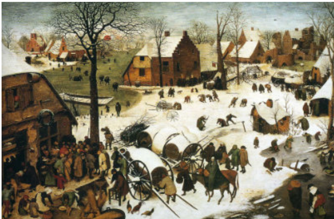
Le dénombrement de Betléem, 1656, Bruegel le Jeune